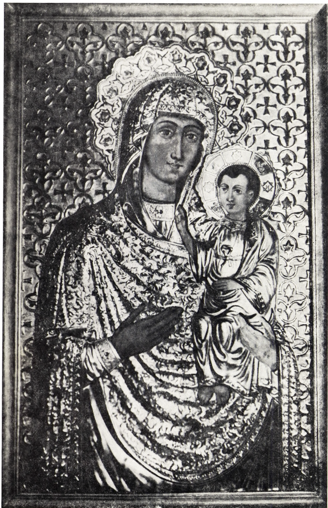
Теребовльская икона Божией Матери. Из кафедрального собора святого Юра в г. Львове